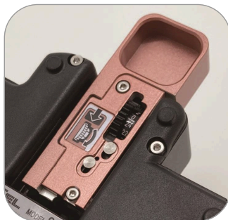
Możliwość zmiany pozycji noża bez narzędzi