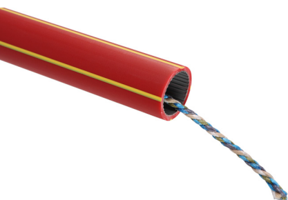
Rura osłonowa (HDPE) z preinstalowaną linką