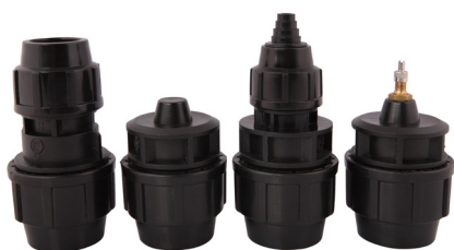
Złączki i zaślepki do rur osłonowych (HDPE)