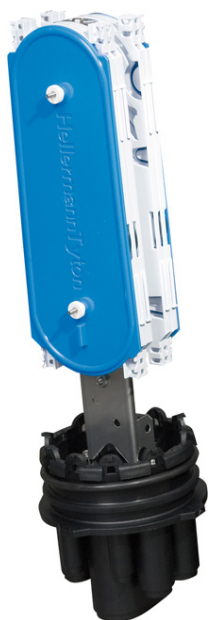
Ośłona złączowa FRBU