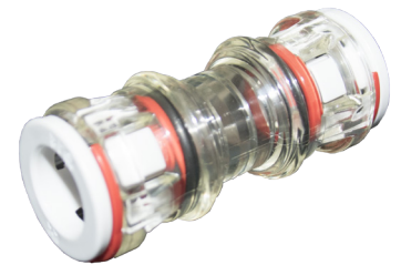
Złączka prosta doziemna

x - ilość i średnica mikrorurek zgodna z tabelą danych technicznych