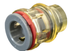
Zaślepka prosta doziemna