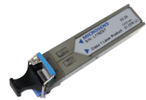
Wkładki SFP i SFP+