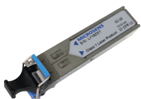
Wkładki SFP i SFP+