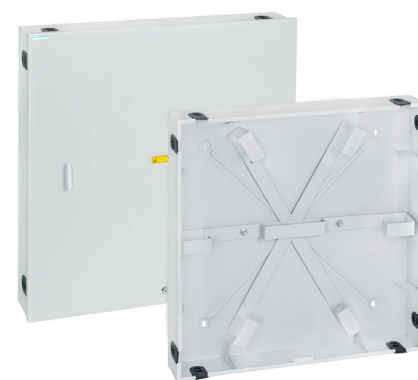
Skrzynka zapasu kabla SZ-1, SZ-1.2