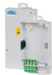
Przełącznica miniaturowa PSM-2/4