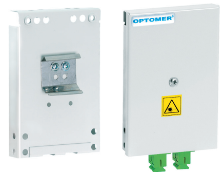
Przełącznica miniaturowa PSM-1/4