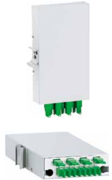
Przełącznica ścienna PSW-12/E/SC