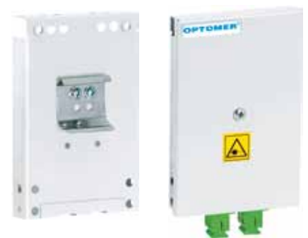
Przełącznica miniaturowa PSM-1/4