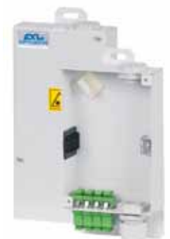
Przełącznica miniaturowa PSM-2/4