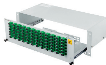
Przełącznica światłowodowa PS-19/72/3U