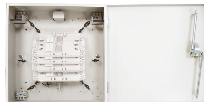
Przełącznica Dystrybucyjna PRW-64U