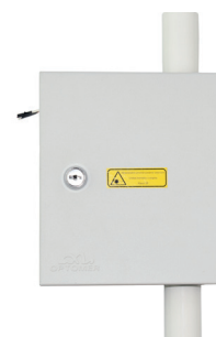
Naścienna skrzynka piętrowa NSP-1