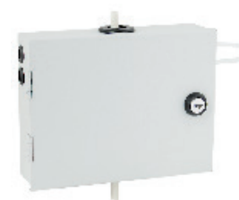
Mufa szachtowa MP-16D