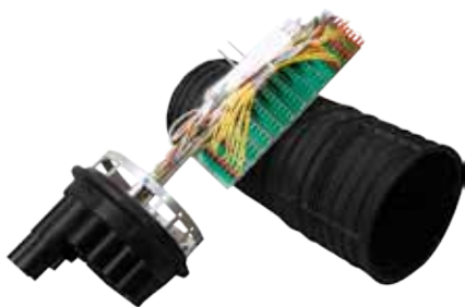
Mufa MUF-3 z możliwością komutacji