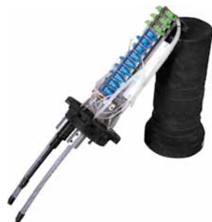
Mufa MUF-2 z możliwością komutacji