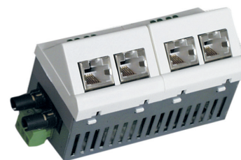
Komponenty sieci FTTO